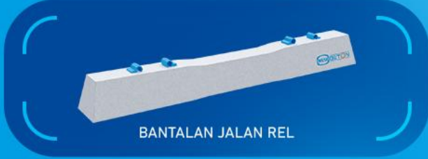
BANTALAN JALAN REL