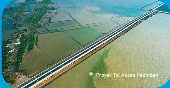
Proyek Tol Akses Patimban